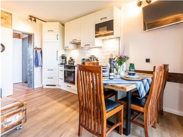
nagelneue Küche mit Pütt un Pan