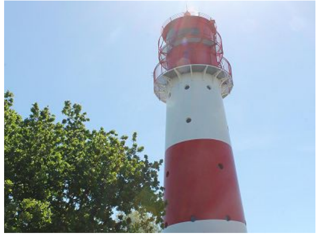
Leuchtturm Falshöft - auch zum Heiraten