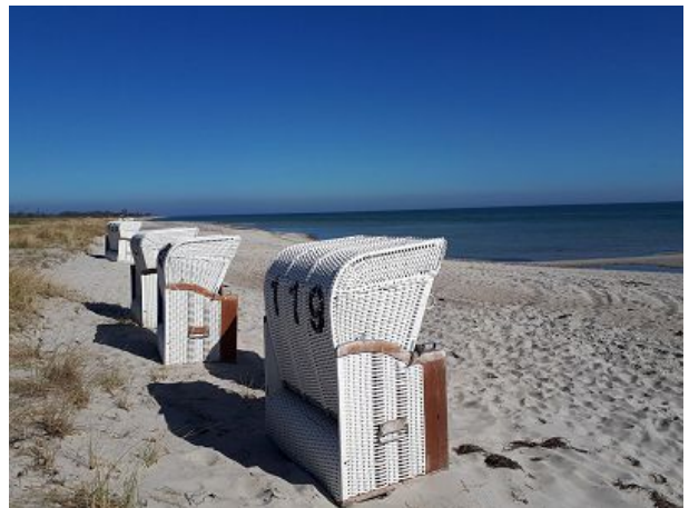
der kostenlose Strandkorb wartet schon