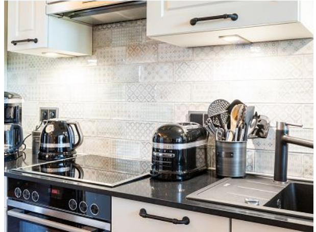
hochwertige Küchengeräte von Kitchen Aid