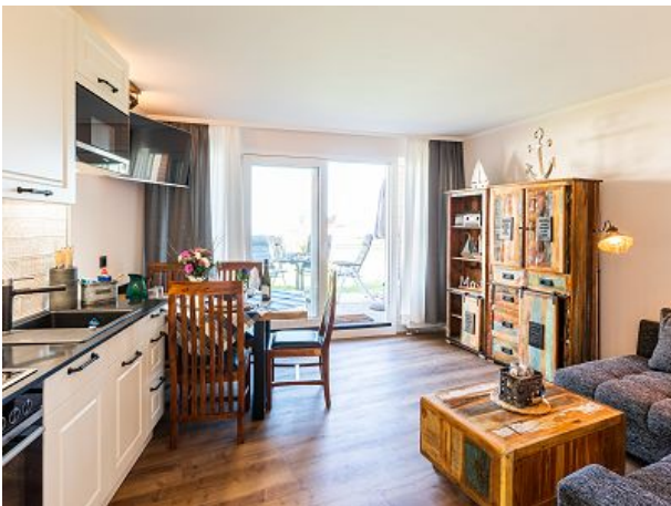
maritimer Shabby Chic meets Industrial