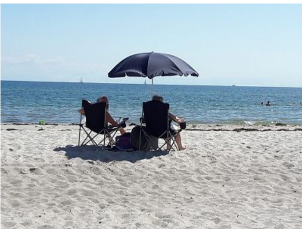
Urlaub fernab vom Massentourismus