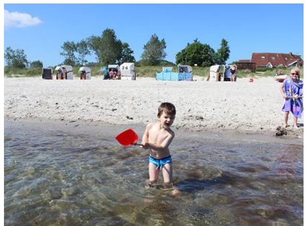
das flach abfallende Ufer ideal für Kids