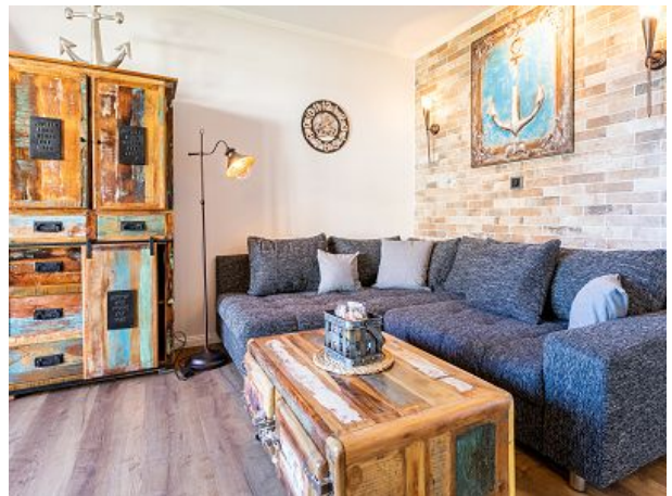
großes Kuschelsofa für gemütliche Abende