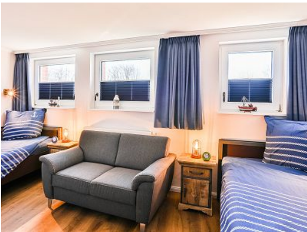
Komfortmatratzen auch im Kinderzimmer