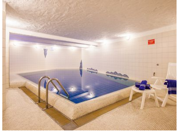
Hauseigenes Schwimmbad für die Gäste