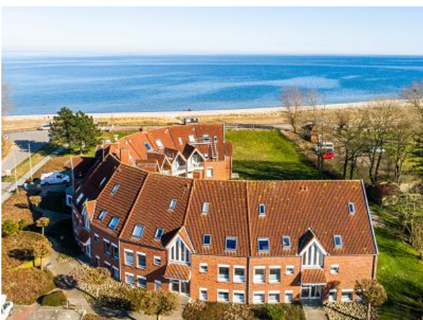
die einzigartige Lage an der Ostsee