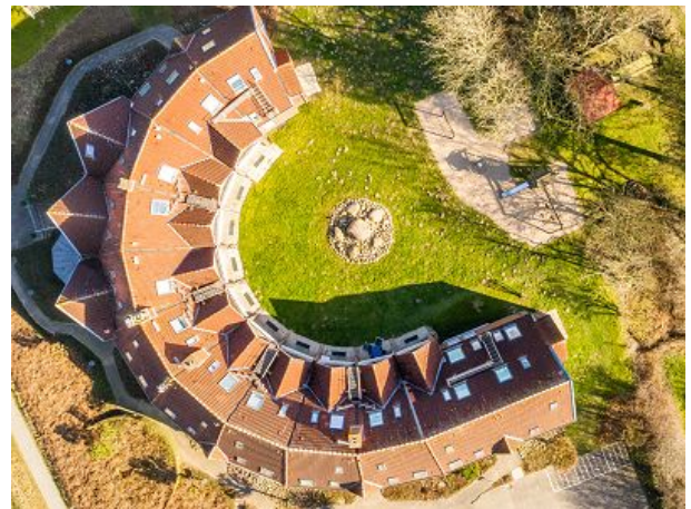
unsere halbmondförmige Appartementanlage