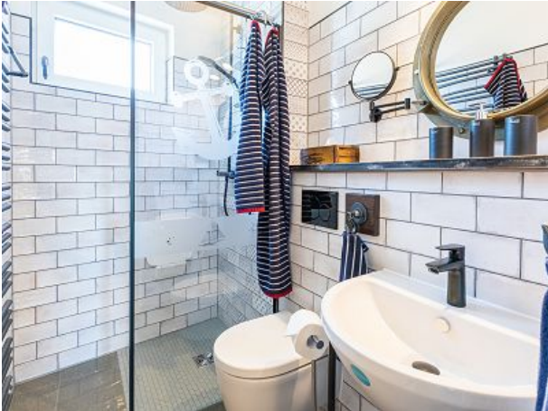
neues Tageslichtbad mit Fußbodenheizung