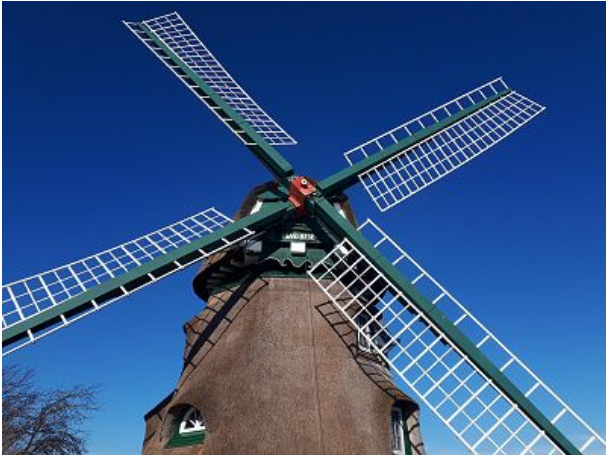
Mühle Charlotte in der Geltinger Birk