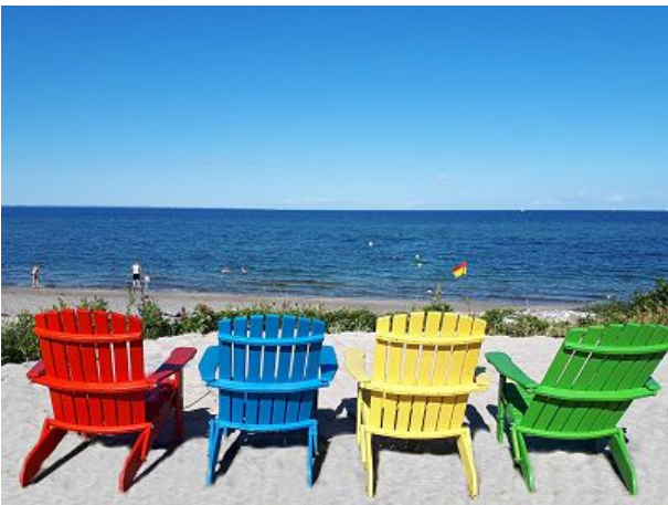
bei uns sitzt ihr in der ersten Reihe