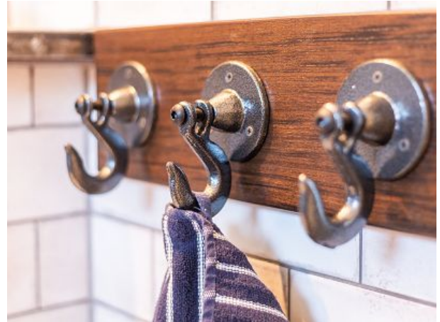
Handtuchhaken im Industrial Design