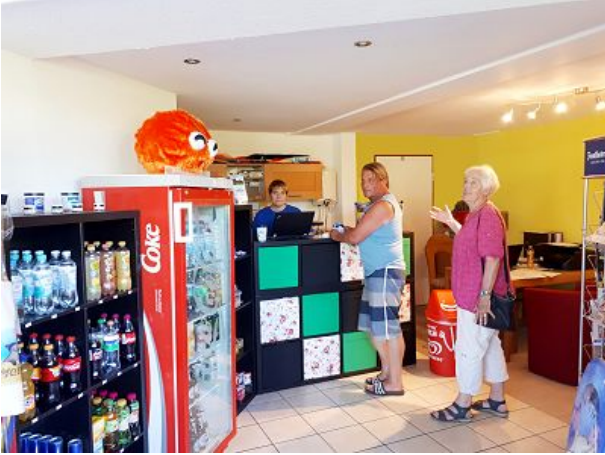
Kiosk mit Brötchenservice im Haus