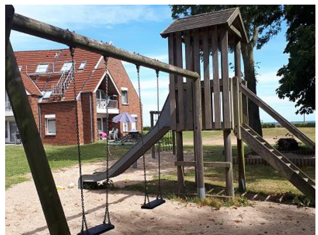
Spielplatz auf dem Gelände